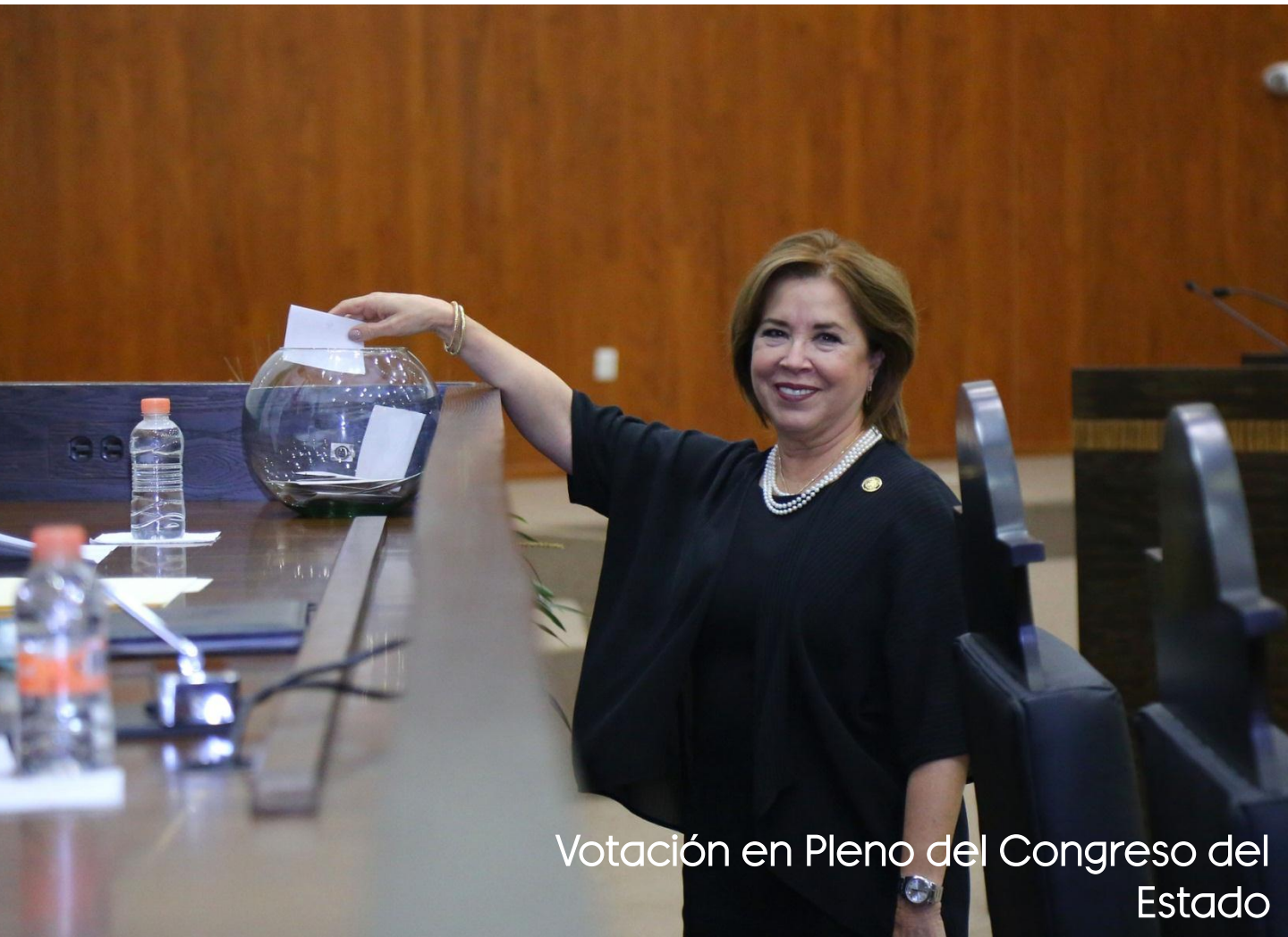
Votación en Pleno del Congreso del Estado