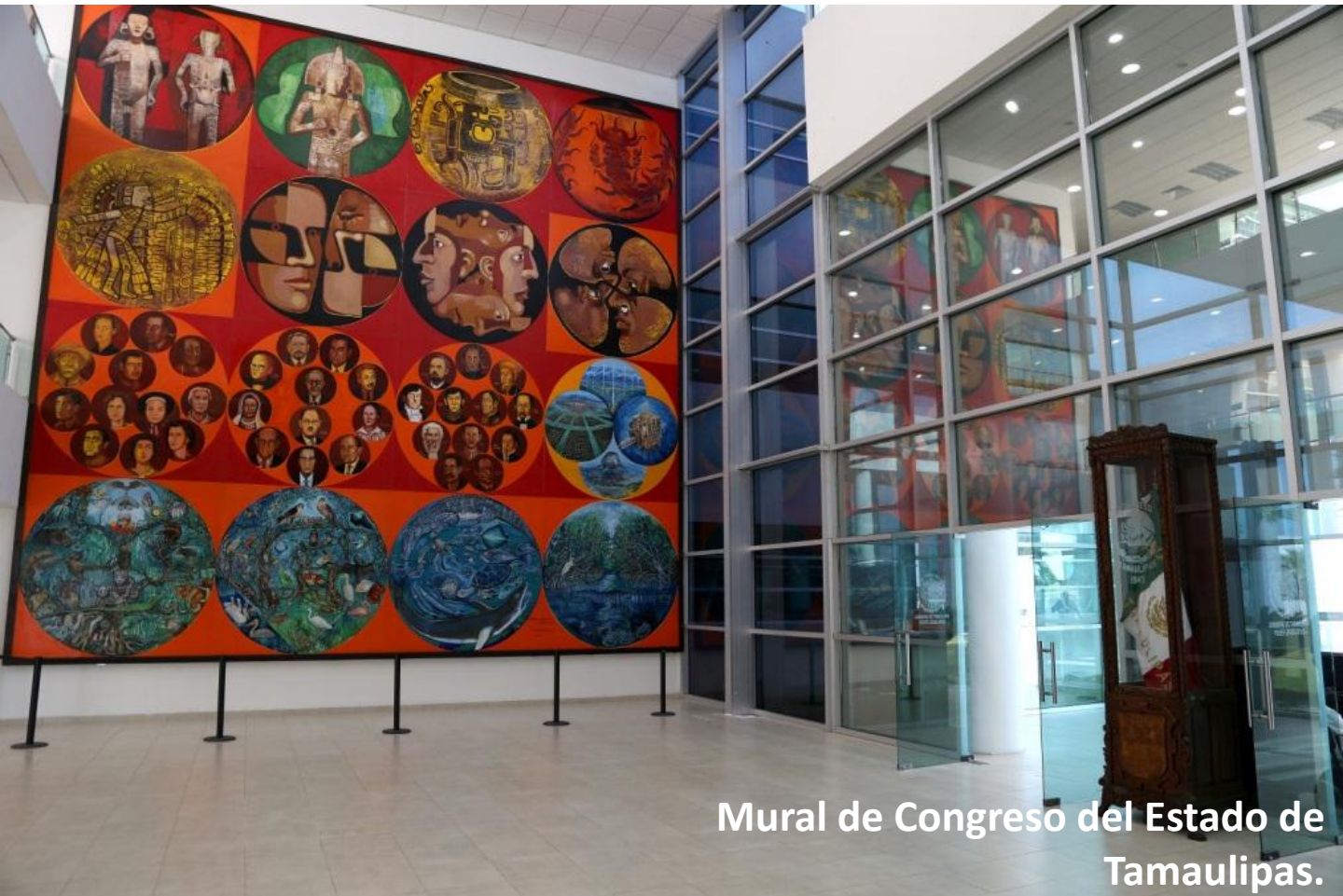
Mural de Congreso del Estado de Tamaulipas.