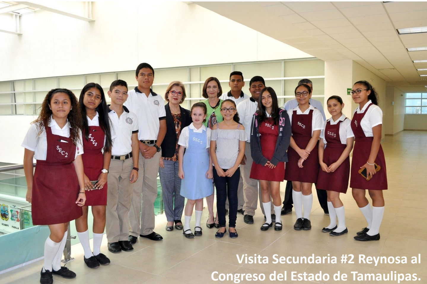
Visita Secundaria #2 Reynosa al Congreso del Estado de Tamaulipas.